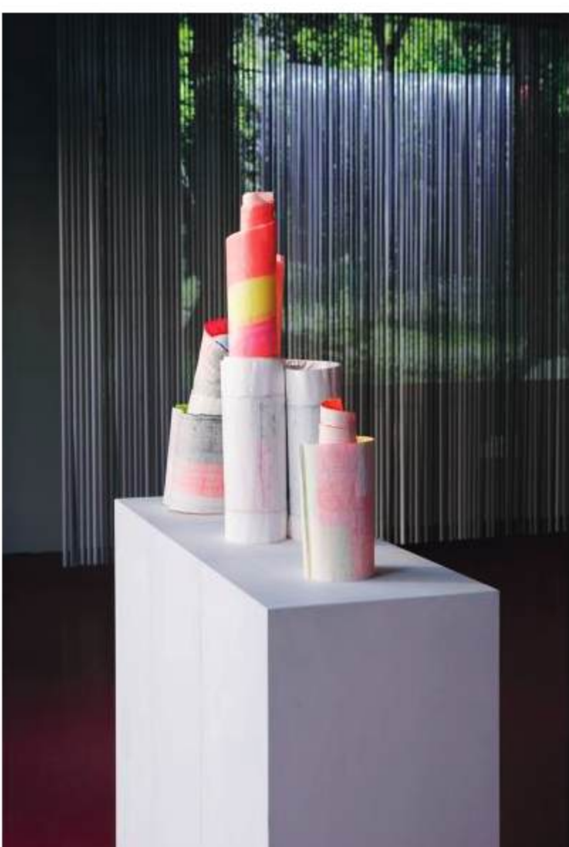
Ausstellungsansicht »ATLANTINNEN, deep dive. measuring. spirit. 52°/13°«, VG: Elvira Lantenhammer, »Japanese Siteplan«, 2017 © VG Bild-Kunst, Bonn 2026; HG: Monika Linhard »Double Square, 2020, © VG Bild-Kunst, Bonn 2026; Foto: Aleksandra Kononchenko

Auf der anderen Seite der Galerie entfaltet sich in den Öl-Gemälden Landscape_BONE und Over the Bridge von Zuzanna Skiba - einer ausgebildeten Kartographin - ein ähnliches Spiel mit perspektivischer Unschärfe wie in Double Square . Man könnte in ihnen ein Panorama eines Feldwegs von oben im Weitwinkel sehen, oder eine mikroskopische Detailaufnahme einer Zellwand. In ihrer Haptik glatt und strukturiert zugleich lenken die Bilder den Gedankenstrom hin zum faszinierenden Perfektionismus der Natur. Aus vielen Mikrostrukturen erwächst eine kohärente Landschaft, die sich auch im Großen wie im Kleinen widerspiegelt. Zur Atlantik dieser Welt wird jede Zelle um uns herum.