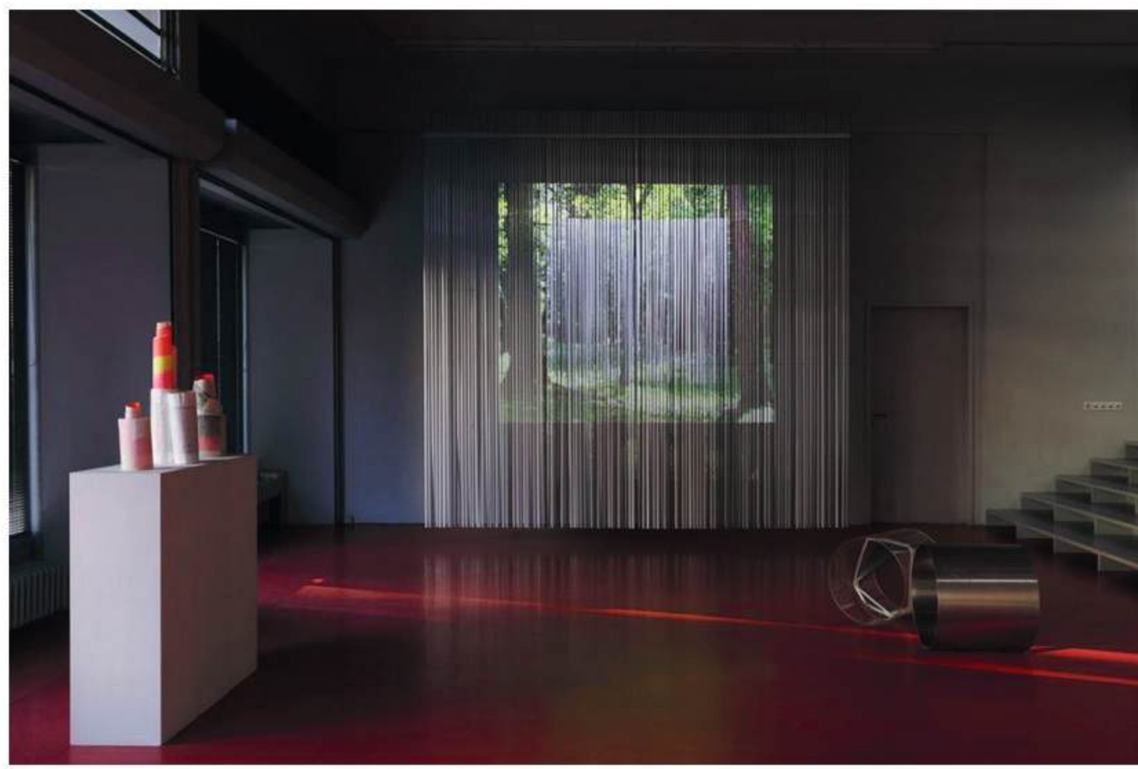
Ausstellungsansicht »ATLANTINNEN, deep dive. measuring. spirit. 52°/13°«, v.l.n.r. Elvira Lantenhammer, »Japanese Siteplan«, 2017 © VG Bild-Kunst, Bonn 2026; Monika Linhard »Double Square, 2020; »Inner Language«, 2020; © VG Bild-Kunst, Bonn 2026

von Sonja Tautz (Einspieldatum: 31.03.2026)