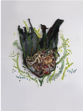
Julia van Koolwijk: Heinz, 2006, Foto auf Stoff, div. Textilien, 56 x 36 cm