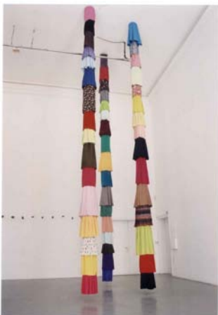
Ulrike Kessl: Rocksäulen, 2003, Röcke, Schnur, 0,4 x 0,4 x 7 m (3-teilig)