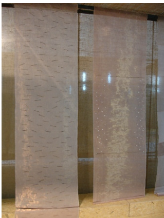
Soumiya Jala Mikou: Ohne Titel, 2006, Kupfer, Leinen