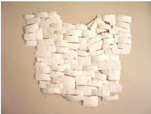
Safaa Erruas: Das Kleid, 2004, Gipsbinden, Nadeln